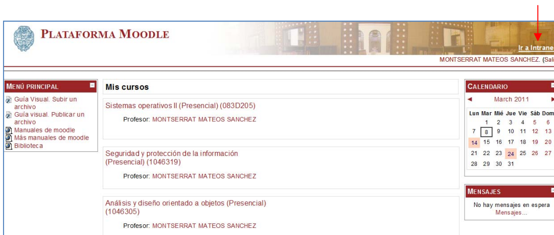
Figura 3.- Acceso al servicio Moodle. Posibilidad de acceder a la Intranet desde Moodle.