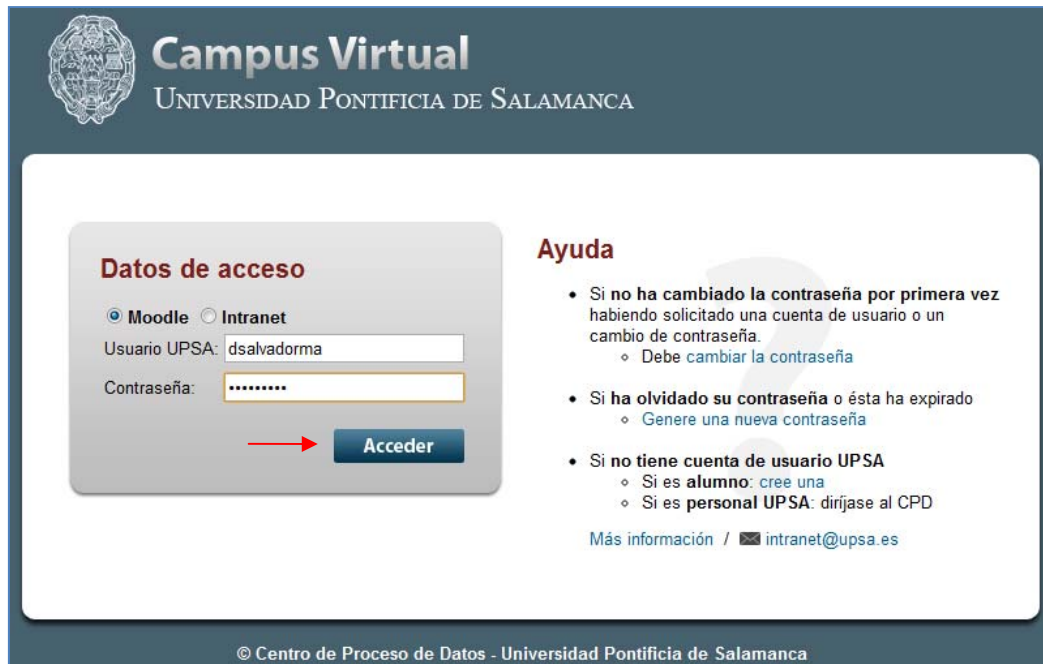
Figura 2.- Página de acceso al Campus Virtual. El usuario debe indicar el servicio al que se desea conectar (Moodle o Intranet) e introducir su nombre de usuario y contraseña.