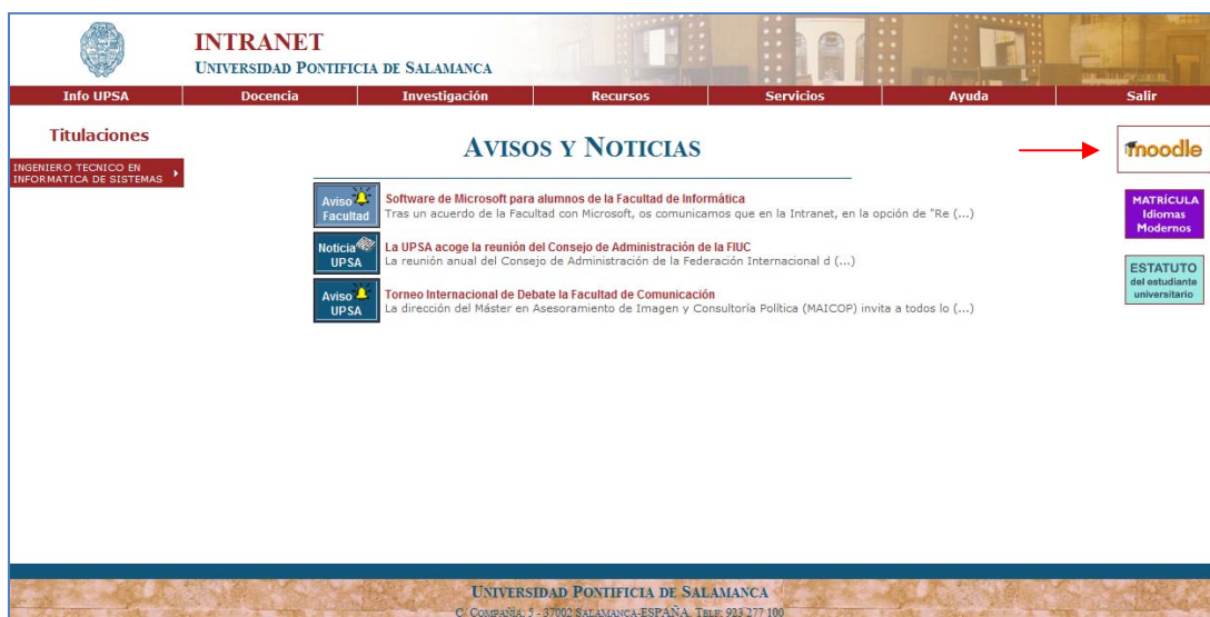
Figura 4.- Acceso al servicio Intranet. Posibilidad de acceder a Moodle desde Intranet.

NOTA IMPORTANTE: Siempre que se quiera abandonar estos servicios es conveniente salir adecuadamente pulsando en el enlace “Cerrar Sesión” en el caso de Intranet o “Salir” en el caso de Moodle.